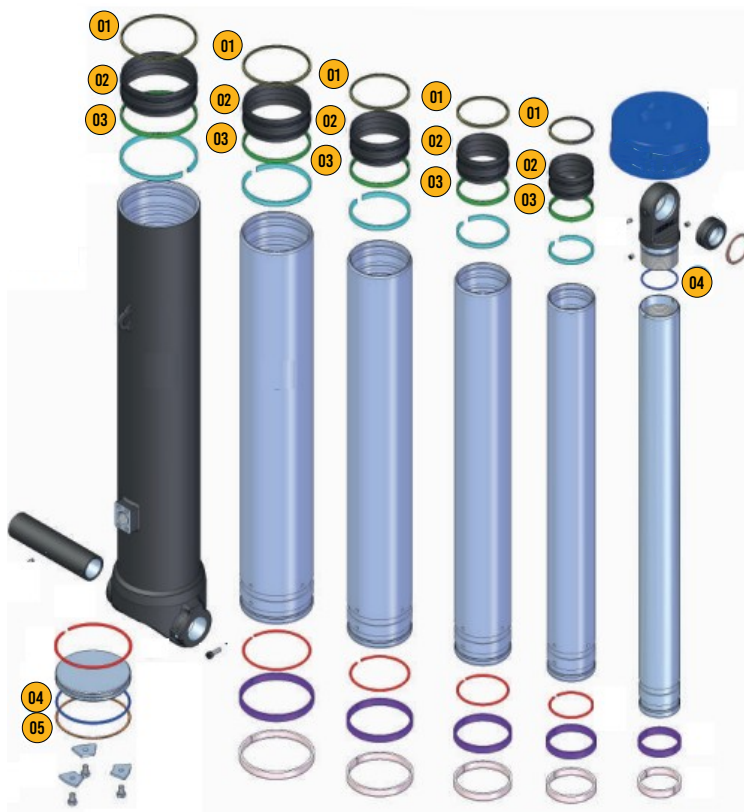
Tabla de Componentes